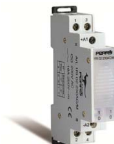
1RI02230AC/M moduláris elektromechanikus impulzus relé